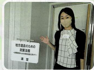
議員向け全国研修へ参加