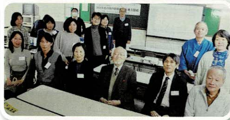
自治体財政の勉強会へ参加