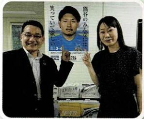
参議院議員との意見交換