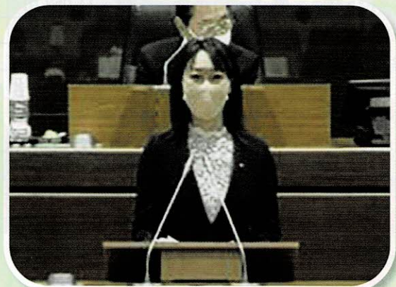
市政に関する一般質問を行う

コロナ禍にあって自治体は、 ワクチン接種など感染症対策の 最前線に立ち、市民の命と暮らし、 地域経済を守っていかねければ なりません。市民生活の実情と、 地域経済の動向をしっかりと把握し、 課題を解決するために、市政を チェックし具体的な政策提言を 行うことが、議会及び議員の役割 です。引き続き、市民福祉の向上 を目指して活動して参ります。