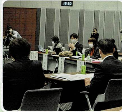
コロナ禍の女性たちの実情をヒアリング