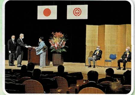
市主催の式典へ参加