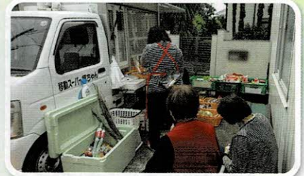
移動スーパーを視察