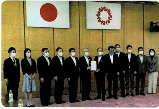
知事公館にて道路整備の要望活動