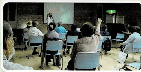
公民館の防災講座へ参加