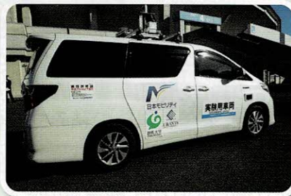
自動運転の実証実験を視察