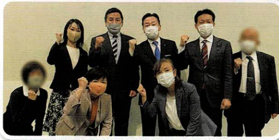
国政・県政との連携