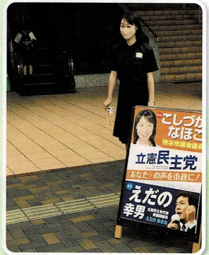
早朝駅立ちにて議会報告を配布