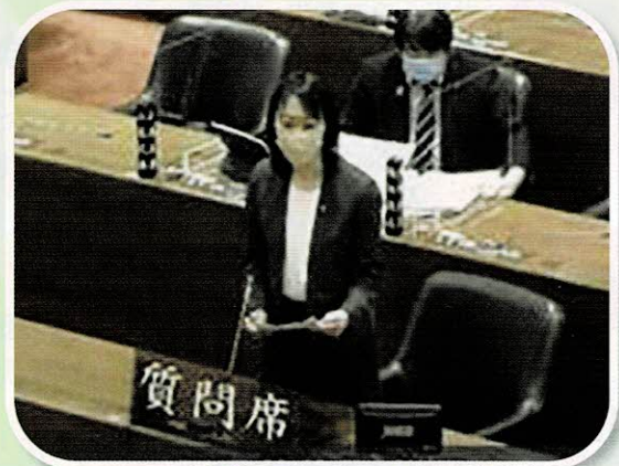
議案に対する質疑を行う