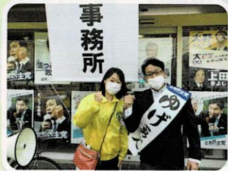
仲間の選挙応援へ